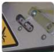
Automatický stříh a zavedení folie