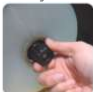
Nastavení tahu folie