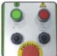
Rychlost otáčení kruhu